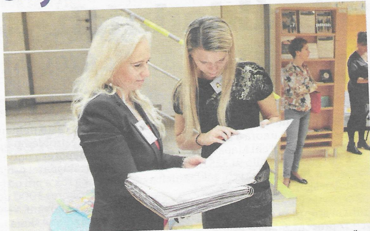
V KNIHOVNĚ města Ostravy proběhl seminář o roli knihoven v posílení čtenářské gramotnosti dětí.

Z podnětů členů realizačního týmu a pracovních skupin již proběhly zahajovací konference, pravidelná setkání pracovních skupin a také další aktivity projektu, např. semináře o kyberšikaně a řídicích elektronické komunikace mezi dětmi, o spoluprá-